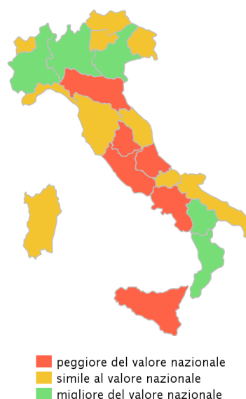
Fumatori per regione di residenza Passi 2012-2015

Nell'ASL VCO sono il 27% delle persone tra 18 e 69 anni fuma, il 22% è ex-fumatore ed il 51% non ha mai fumato.